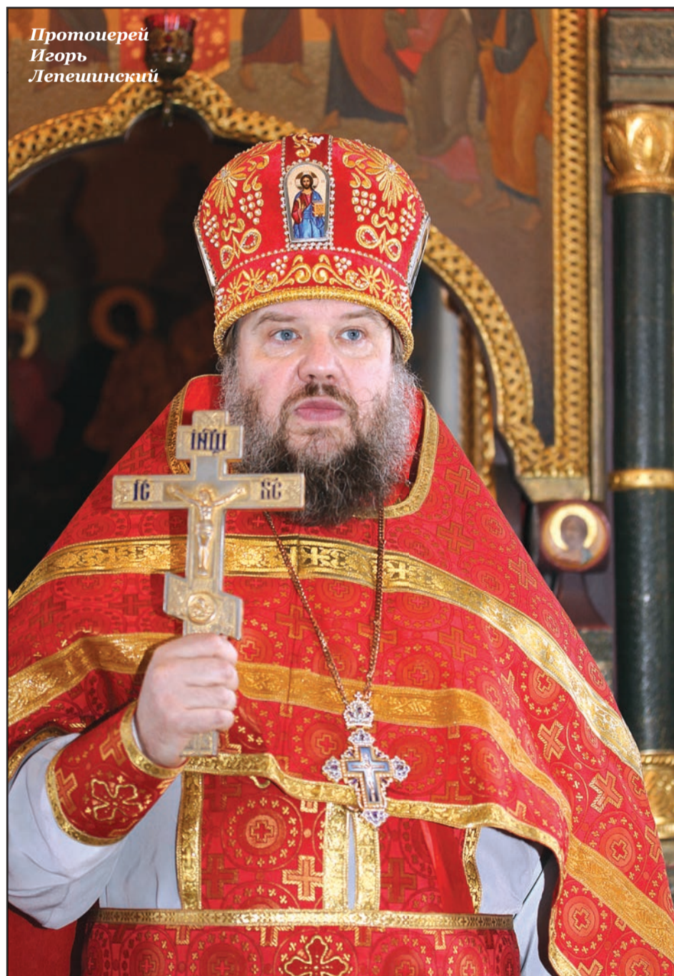
Протоиерей Игорь Лепешинский